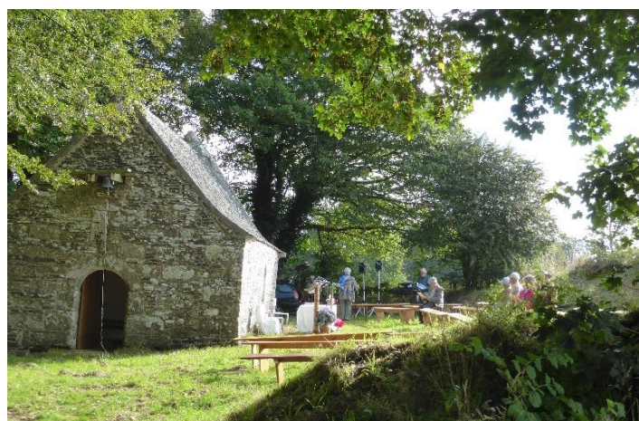
L'intérieur et l'extérieur de la chapelle entourée de chênes en 2014.

Yvon Castel 2021. Sources : conseil municipal du Cloître, archives diocésaines, inventaire Coufon des églises du Finistère de 1959,